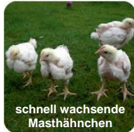
schnell wachsende Masthähnchen